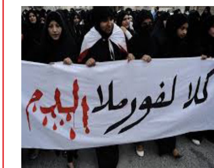
كل فورملا الليم