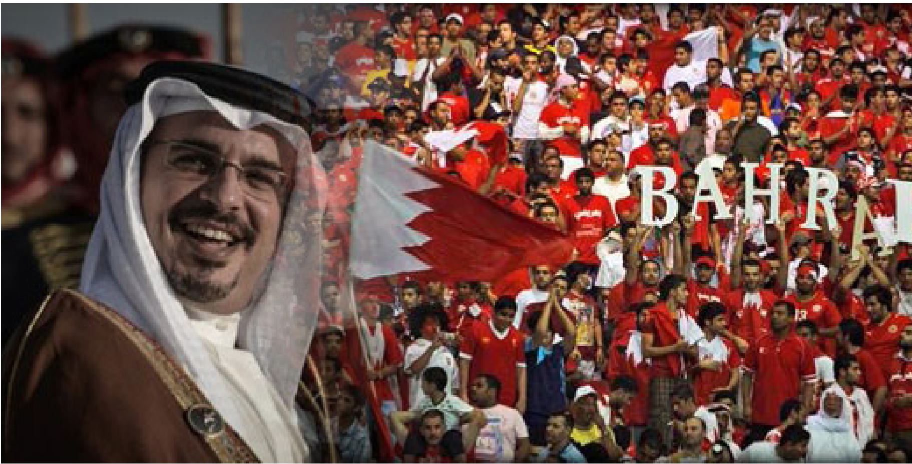
هواتي أودُ. وأثريوا من ماء البحر

البحرين.. هذا الأرخيبل الصغير الذي لاتتارقه الأزमत السياسية والحقوقية، والأمنية التي يصاحبها شعور عميق وحاد من غالبية سكانها بالظلم والتمييز، والحرمان.. من المؤكد أن وجهها الحقيقي ليس ذاك الوجه الذي تعكسه الأجواء الصحابية